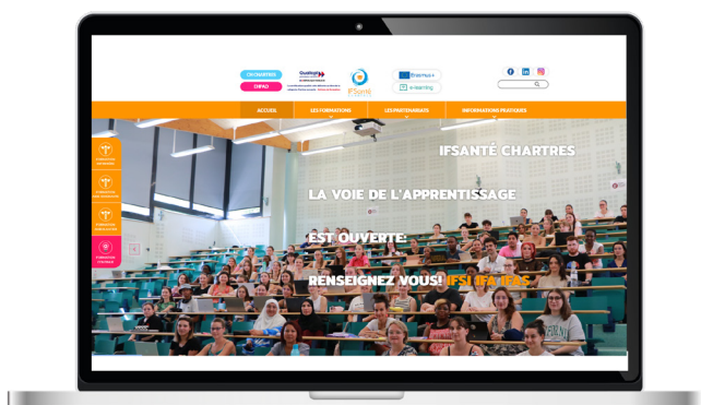
IFSanté Chartres www.ifsifas.ch-chartres.fr

SÉLECTION FORMATION FINANCEMENTS VIE PRATIQUE