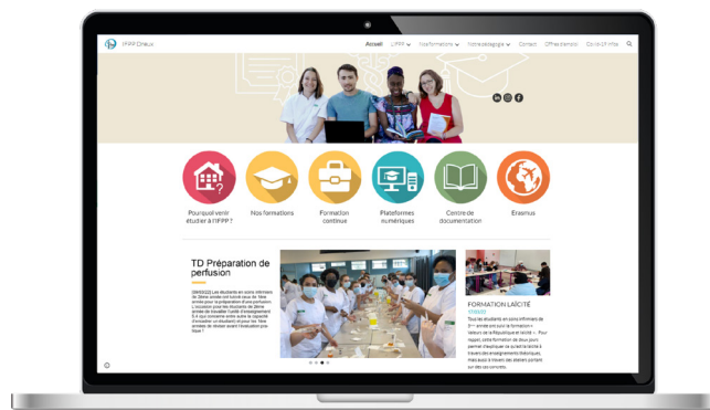
IFPP de Dreux www.ifsifas-dreux.fr