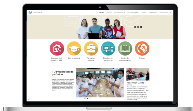
IFPP de Dreux